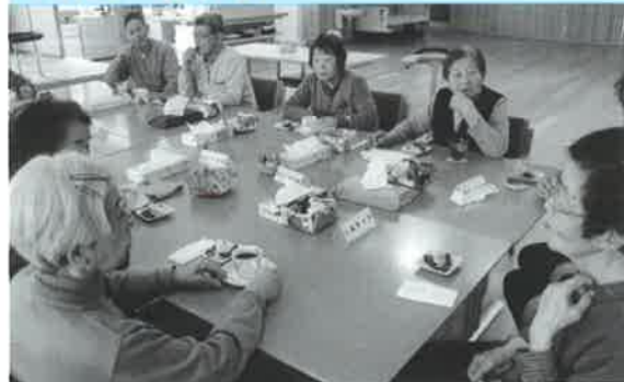
運動後の休憩。おやつタイムです