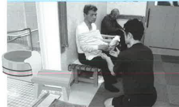
温泉でごゆっくり温まってください