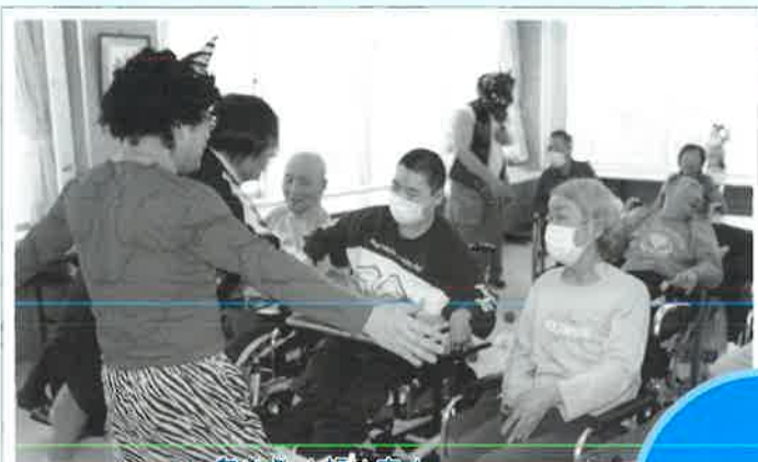
鬼は外！福は内！ 皆マ心で紅白玉を投げ邪気を追い払いました