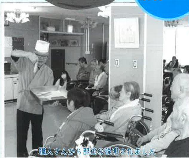
職人さんから部位の説明されました