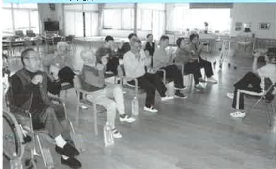
安全に安心して座ったままでの体操