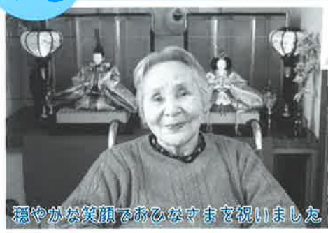
穏やかな笑顔でおひなさまを祝いました