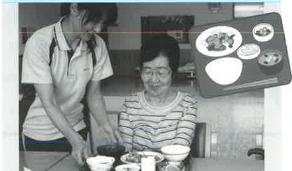
栄養満点の食事、お召し上がりください