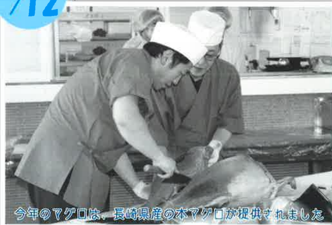
今年のマグロは、長崎県産の本マグロが提供されました