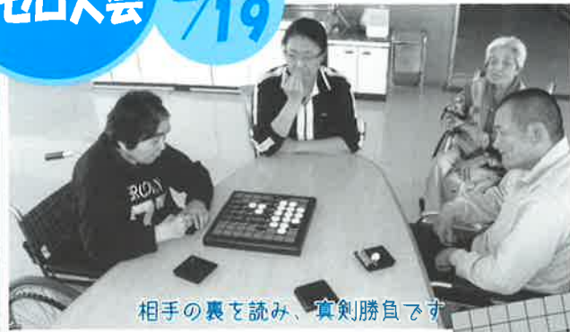
相手の裏を読み、真剣勝負です