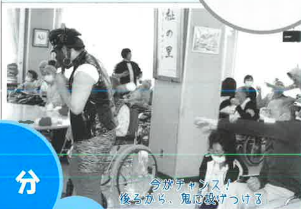
今がチャンス！ 後ろから、鬼に投げつける