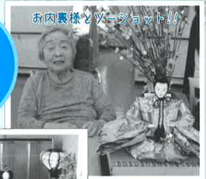
お内裏様とツーショット!!