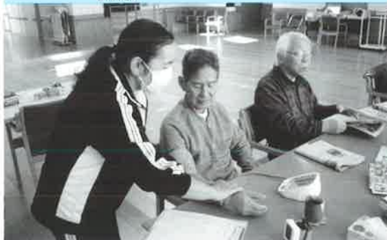
体温・血圧測定中