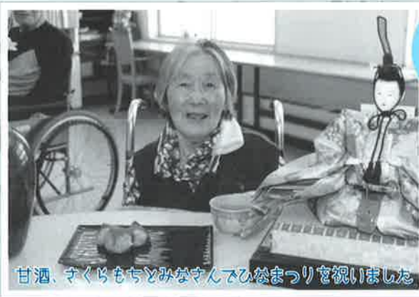
甘酒、さくらもちとみなさんでひなまつりを祝いました