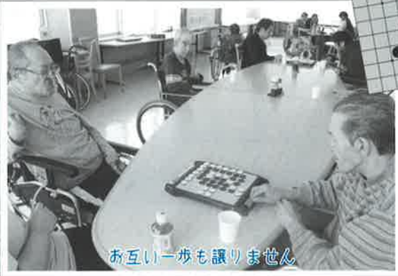
お互い一歩も譲りません