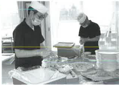
おいしいお寿司をありがとうございます