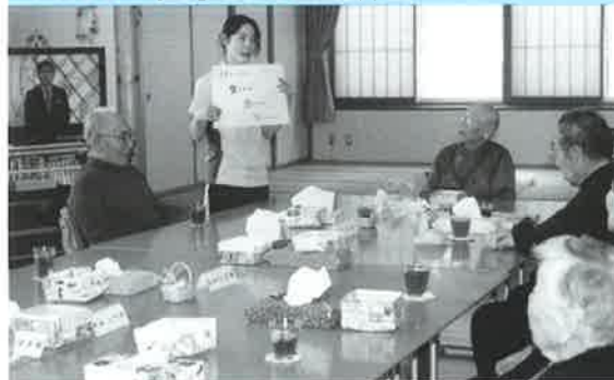
声を出し、お口を動かし体操 これで食事を安全に美味しく頂けます