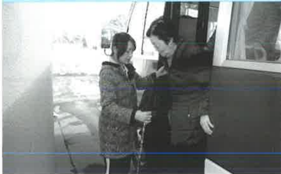
おはようございます お待ちしておりました