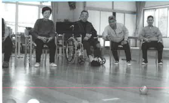
今日のご利用者さんに人気レクリエーション ポッチャを楽しんでいます。