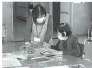
この部分は何色がいいかしら？

ご利用者さんと楽しく絵を 描きながら、ちょっとした アドバイスも。皆さん思い 出に残る時間を過ごされて います。