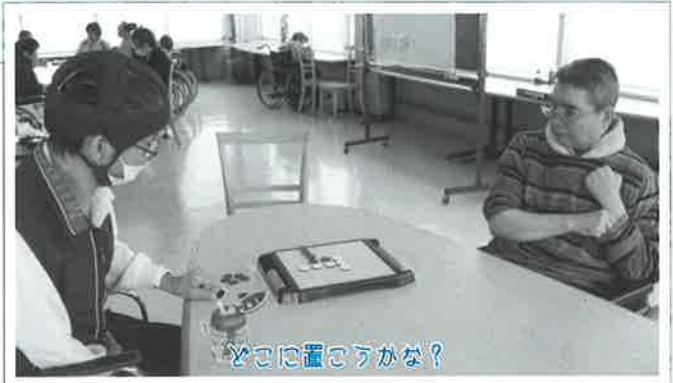
どこに置こうかな？