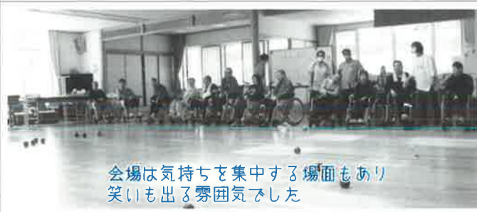
会場は気持ちを集中する場面もあり 笑いも出る雰囲気でした