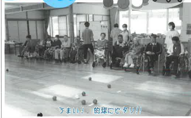
うまい!! 的球にヒタリ!!