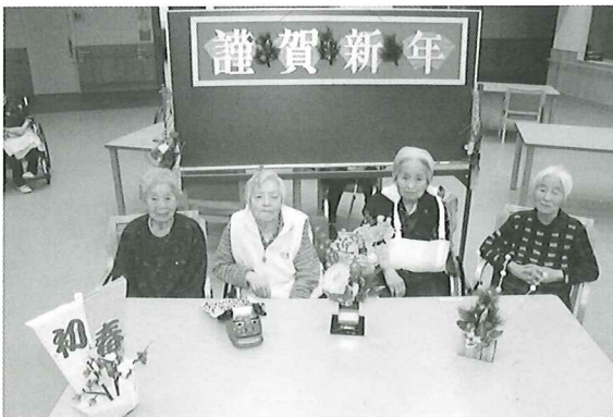
今年の主役は私達よ

2022年は寅年です。当施設では男性 1名、女性4名の方が年男、年女を迎え られます。昨年は感染症の蔓延で大変な 一年でしたが、今年は安心・安全な毎日 であることを祈りながら、抱負を語って いただきました。