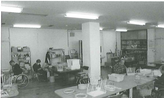
手工芸教室 手工芸作品はここで作りられています