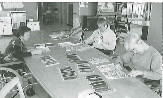
絵画教室 たくさんの色を使って自分だけの世界