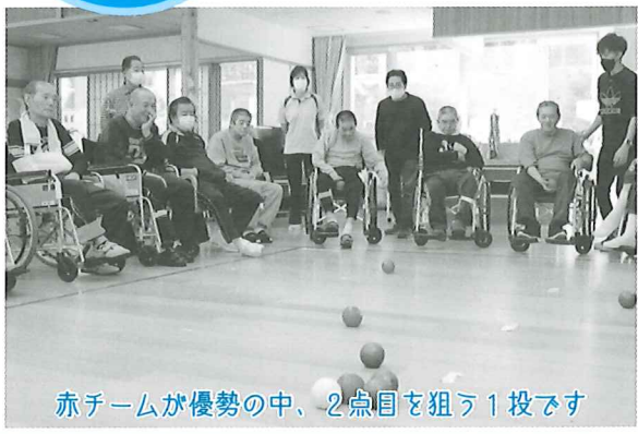
赤チームが優勢の中、2点目を狙う1投です