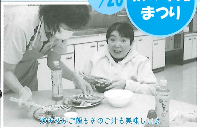
炊き込みご飯もきのこ汁も美味しいよ