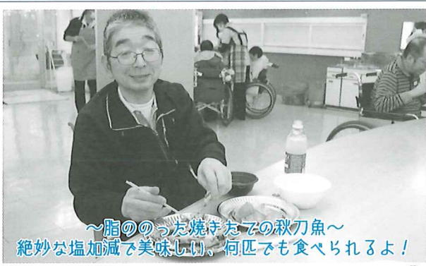
～脂ののった焼きたての秋刀魚～ 絶妙な塩加減で美味しい、何匹でも食べられるよ！