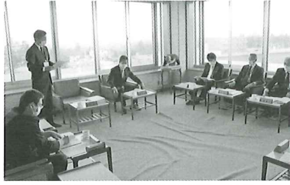
社会福祉法人として、経営組織のガバナンス強化や財務規律整備への細やかな対応が求められます。

冒頭理事長あいさつでは、抑えられつつある感染症拡大も、想定される第6波の状況を注視しながら、引き続き基本的な感染症対策に努め、ご利用者さま、そして職員の健康と安全を守りたいとしました。