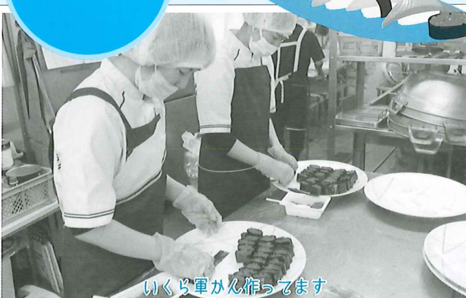
いくら軍かん作ってます