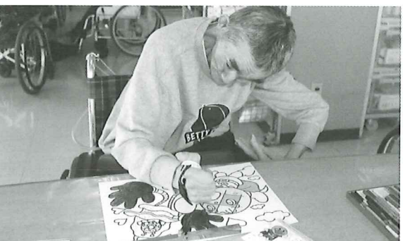
絵画教室 ゆっくり、ていねいに色をぬっていきます