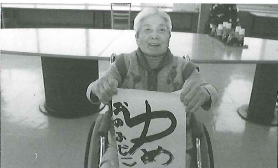
書道教室 「ゆめ」がなうといいですね