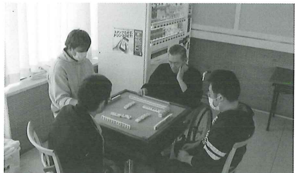
マージャン教室 真剣勝負！負けたくない