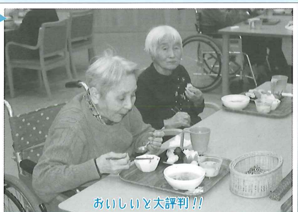
おいしいと大評判!!

握り寿司の季節になりました。今年はサーモン、鮪、海老、イカ、玉子、イクラのお寿司を準備しました。みなさん美味しそうに召し上がって頂き、用意していたお寿司を完食されていました。