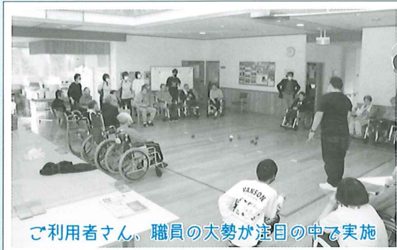
ご利用者さん、職員の大勢が注目の中で実施