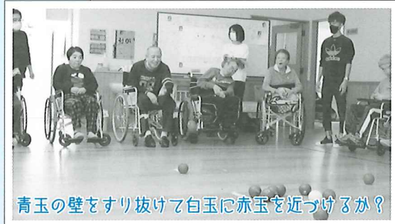
青玉の壁をすり抜けて白玉に赤玉を近づけるか？