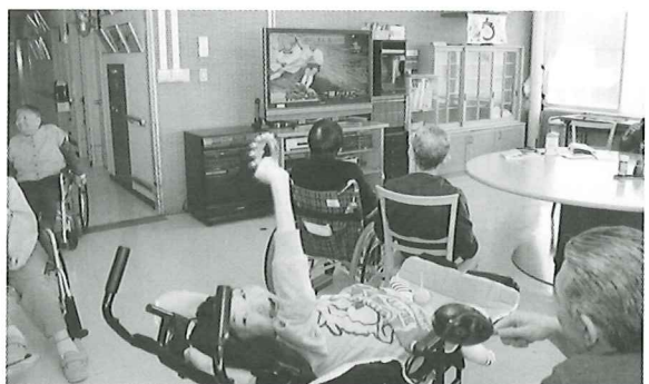
コーラス教室 盛り上がっていこうせ!!