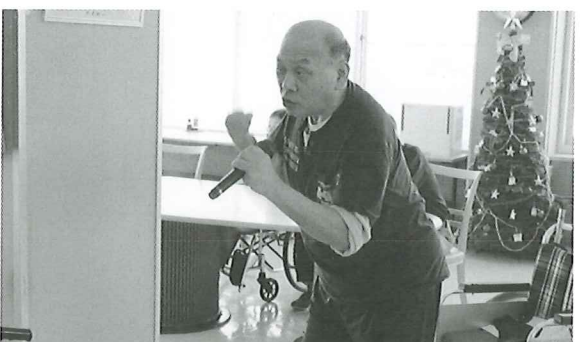
カラオケ教室 こぶしをにぎり大熱唱

施設をご利用される方に意欲的に参加していただけるような活動を取り入れ工夫をしていきます。