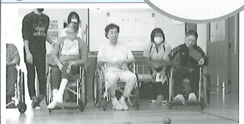
療護、更生の混合チーム いつもと違ったプレイに期待です