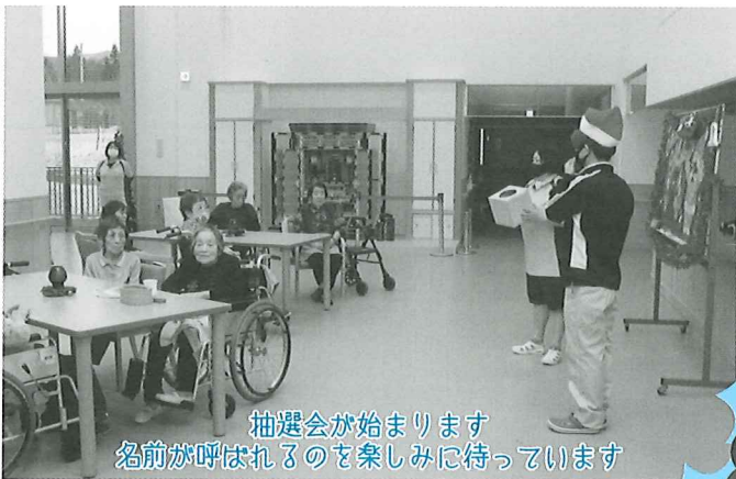
抽選会が始まります 名前が呼ばれるのを楽しみに待っています