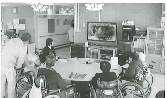
カラオケ教室 のどじまん大会 1位はだあれ？