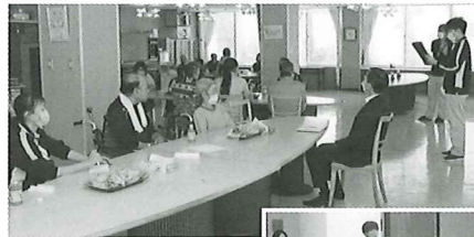
真剣に聞いてます 更生部のみなさん!!

より快適な施設生活を送れるよう話し合いました。みなさん貴重な意見ありがとうございました。